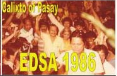
Calixto of Pasay EDSA 1986