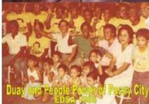
Duay and People Power of Pasay City EDSA 1986