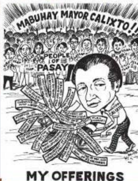
MABUHAY MAYOR CALIXTO!! PEOPLE OF PASAY MY OFFERINGS